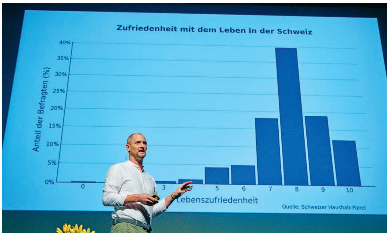
Un 8 sur une échelle de 0 à 10: Monsieur et Madame Suisse s'estiment heureux.