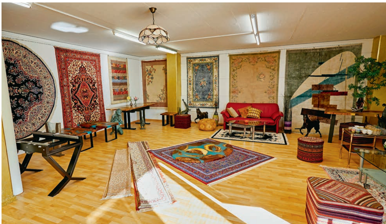
Des tables et autres éléments de décoration sont également en vente.