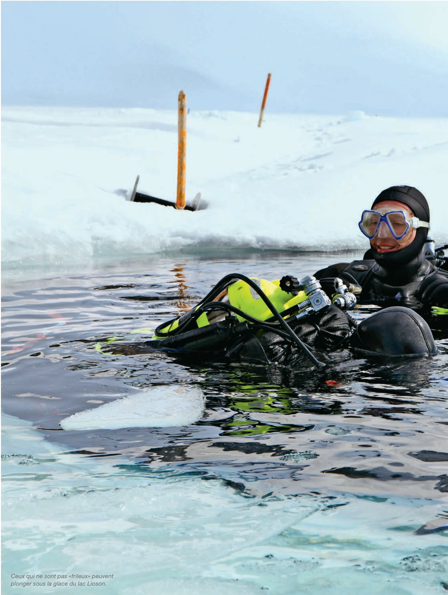
Ceux qui ne sont pas «frileux» peuvent plonger sous la glace du lac Lioson.