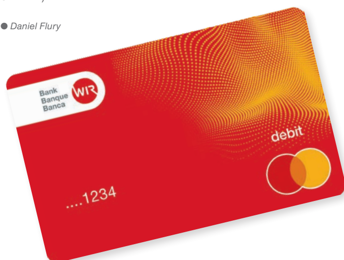
Les avantages de la carte de débit Mastercard de la Banque WIR sont sans pareils.