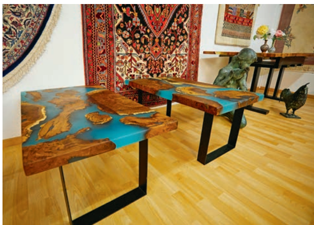
Les tables en bois et en résine époxy viennent de Colombie.