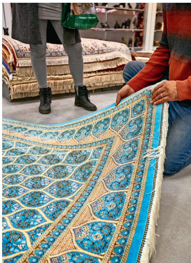
Une cliente a choisi un tapis persan en soie.

À intervalles réguliers, des livraisons de tapis arrivent de Perse, du Pakistan, de Chine, de la Turquie et d'autres