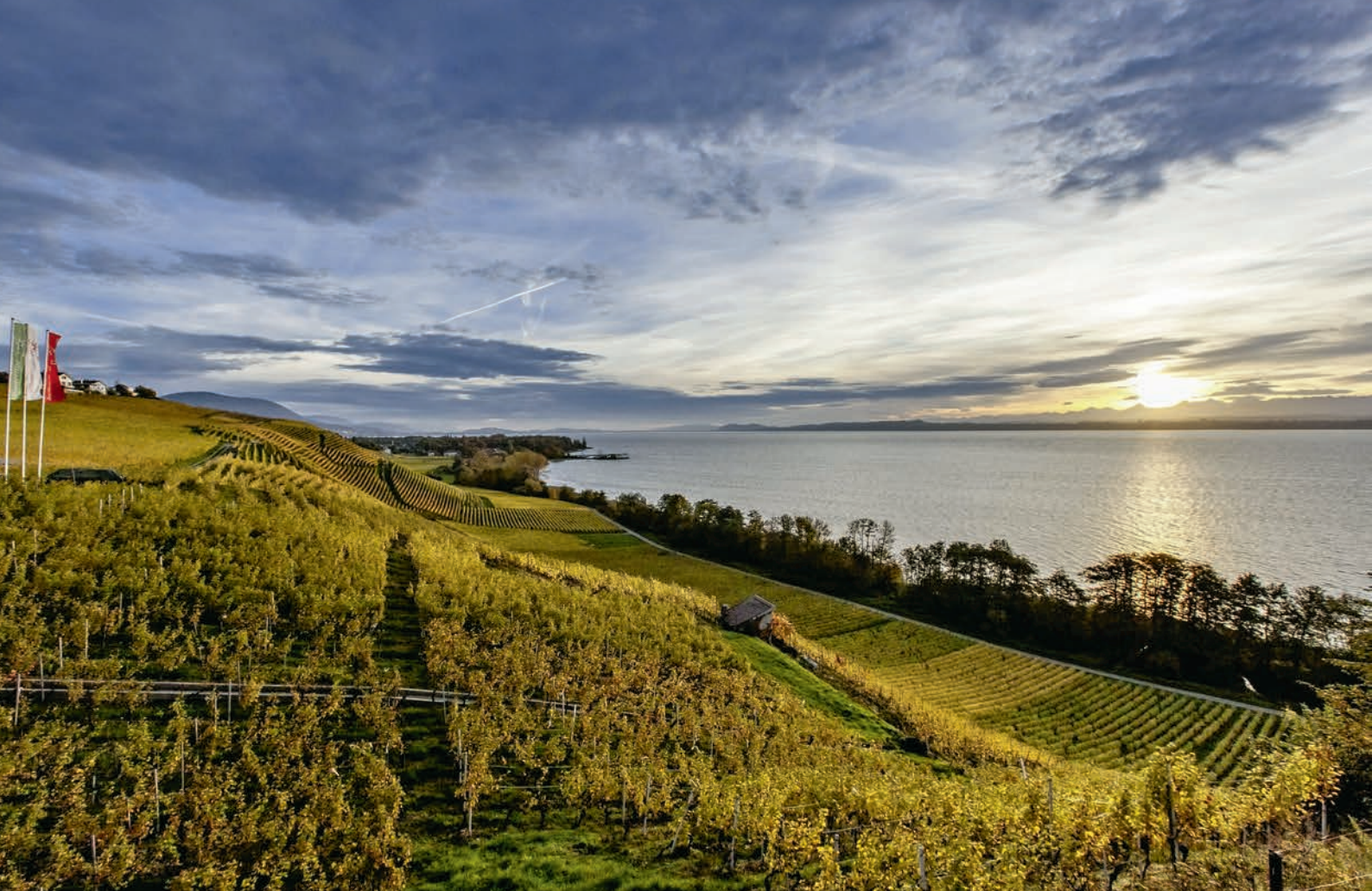
Les trois lacs: le lac de Neuchâtel (photo), de Biemme et de Morat.