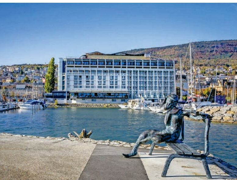
L'hôtel Beaulac à Neuchâtel sera le point de convergence du voyage à vélo 2025.