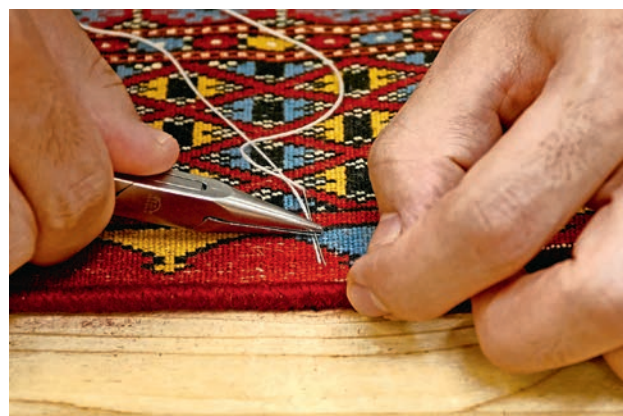
Restauration: un collaborateur recoud le bord d'un tapis à l'endroit où se trouvait une frange à l'origine.