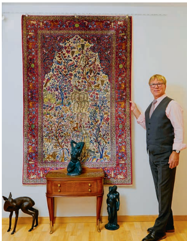
Ce tapis précieux, orné d'un motif représentant le jardin du paradis, fait partie des rares pièces qui ne sont pas destinées à la vente.