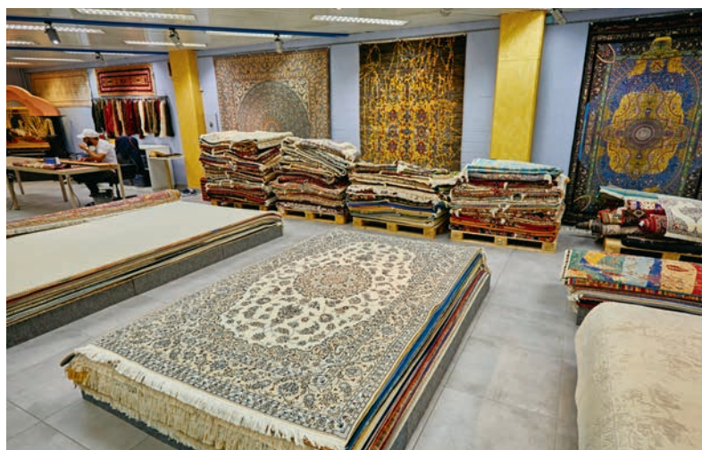
Sur une surface de 3000 m 2 , chaque client trouve son bonheur.

Sous le même toit se trouve également un commerce de gros. Finalement, des pièces sont stockées en franchise de douane dans un local séparé, soigneusement sécurisé, en attendant d'être exportées sous la surveillance attentive des fonctionnaires de douane, dans des camions munis de scellés.