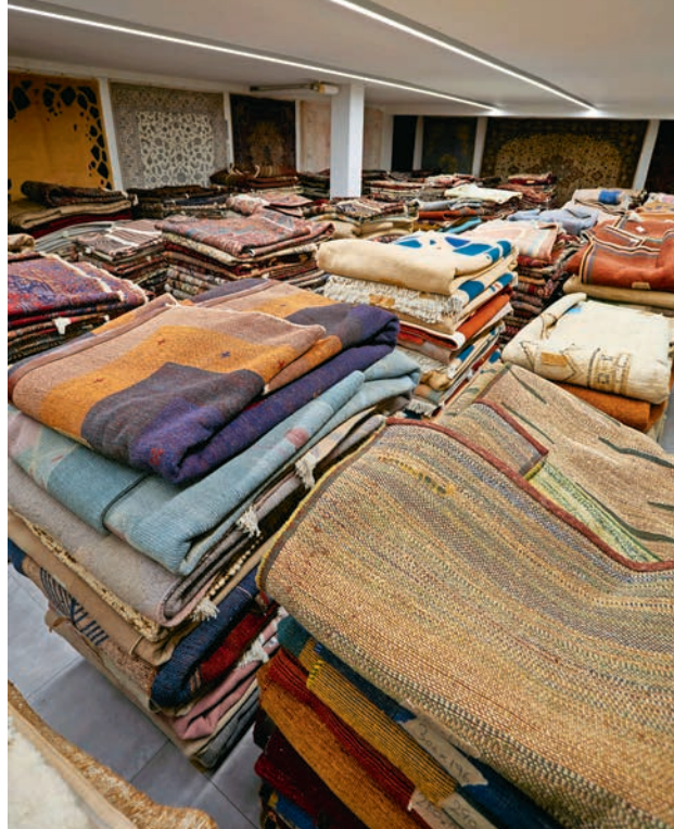
Les clients ont également accès au stock de tapis.