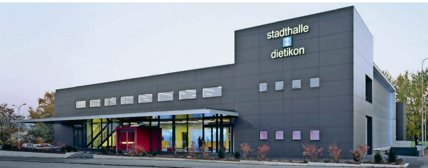
La salle municipale de Dietikon est le nouveau domicile de la WIR-Expo Zurich.