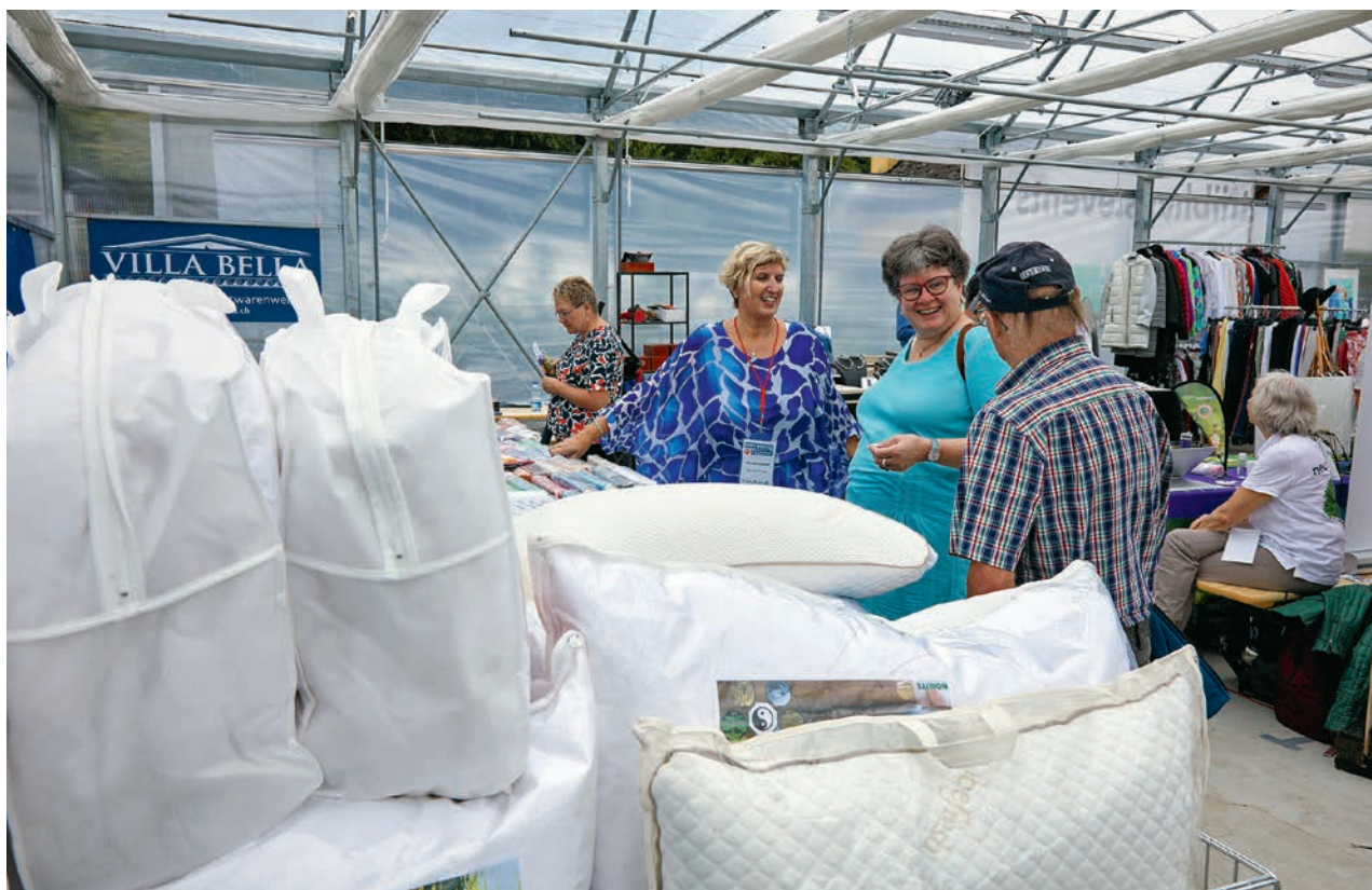
Impression de la foire WIR à Rothrist.