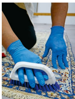
Nettoyage humide d'un tapis.