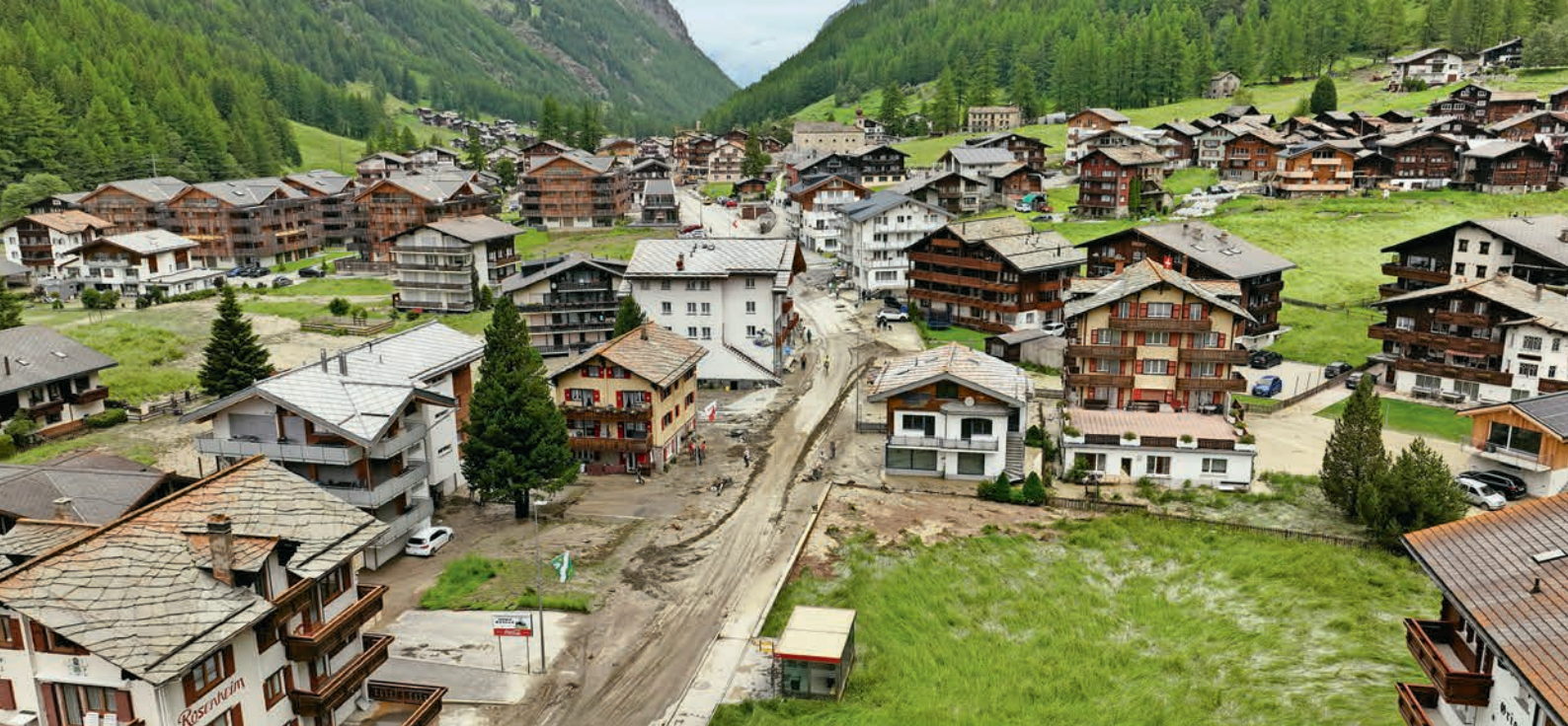
La commune de Saas-Grund en Valais a été touchée par un glissement de terrain en 2024.