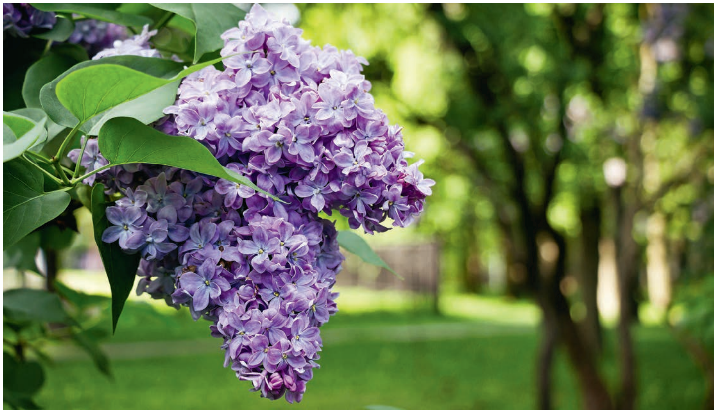
Le lilas charme le nez et les yeux mais il n'est plus possible de l'acheter pour en décorer le jardin.

Même parmi les professionnels, une grande incertitude plane encore en ce qui concerne les alternatives à utiliser. Après une procédure en consultation relativement longue