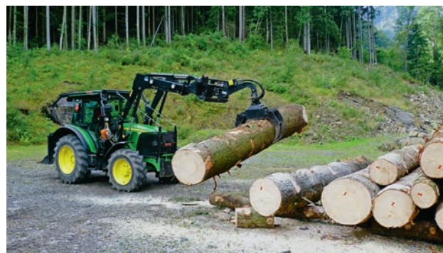
À Isenthal, le Parrainage a participé au financement d'un nouveau tracteur sylvicole.