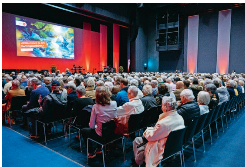
Lors de la Rencontre d’automne au centre des congrès KKL à Lucerne, 900 places sont à disposition – la manifestation comprend toujours aussi un apéritif dînatoire.